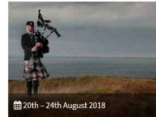
20th - 24th August 2018