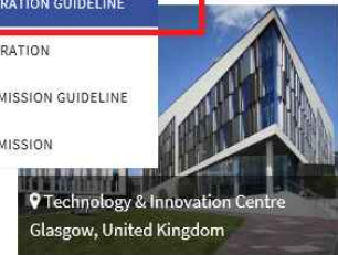
Technology & Innovation Centre Glasgow, United Kingdom